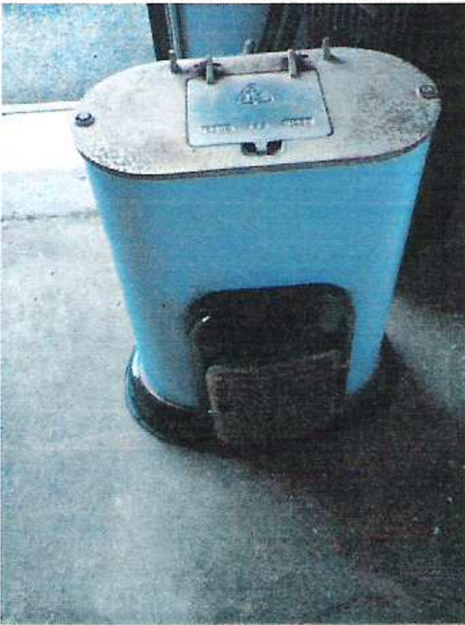
Kamna Club, 1 ks á 100,- Kč