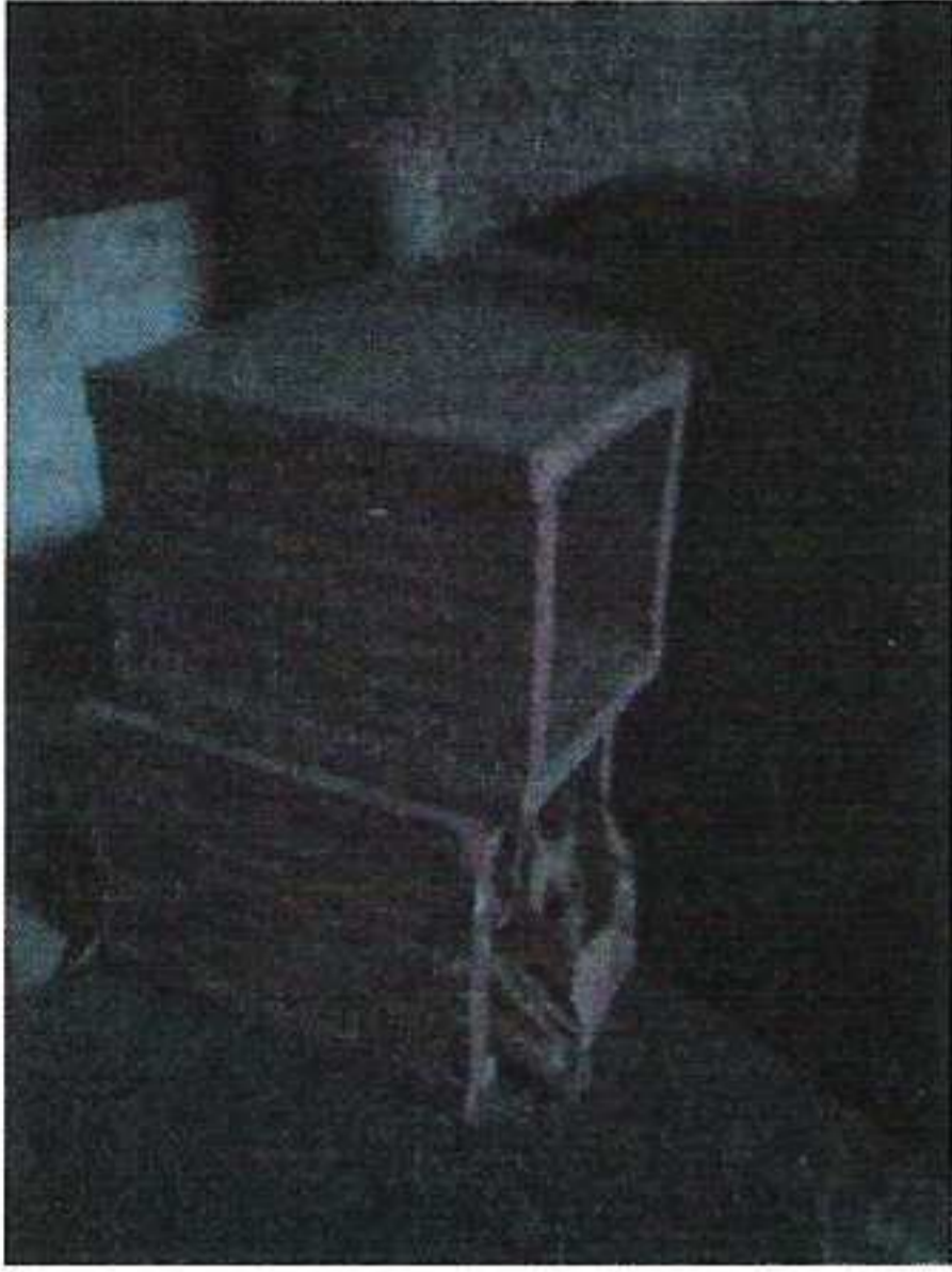
Komínová vložky hranatá, 6 ks á 20,- Kč/ks