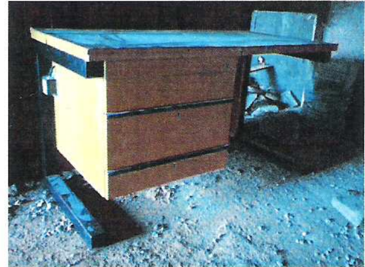
Stůl masivní, kovový rám, šuplíky, 1 ks á 100,- Kč

Bližší informace podá starosta obce, tel.č. 724 180 480.