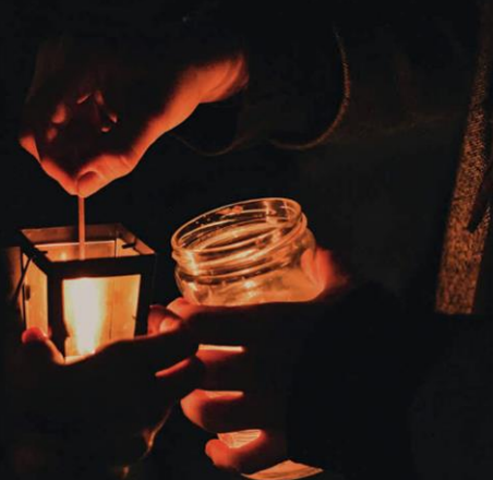
Betlémské světlo v regionu